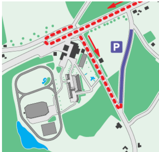
Circuit en provenance de Berne